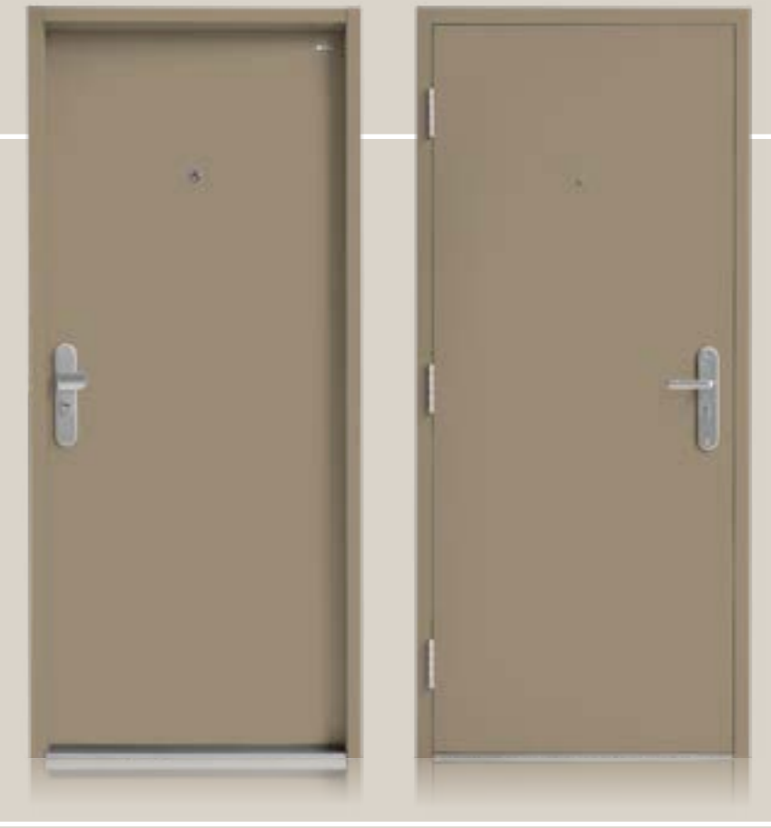
F3/G hladké / mocca